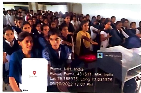
Students and Staff Taking the Oath on Child Marriage Prevention