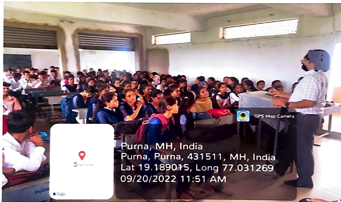
Students present at the Workshop